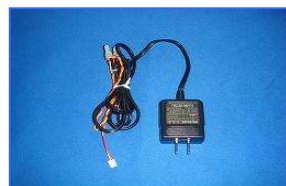
専用 AC アダプター (40 台迄接続可能)