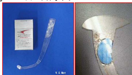
北電子現行筐体クレマン