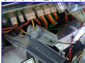
入替時も簡単作業

《取付方法》 電源渡り線と不正出力線を予め接続します。遊技台への取付は所定の線2本をクランプセンサーに嵌め込むだけです(非接触)