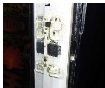
基板上部品への接触防止