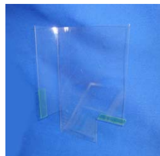
M K P 7 8 J (3種1組)

京楽の最新機種「ぱちスロ必殺仕事人」でもART関連のゴト行為が懸念されます。前機では甚大な被害が発生し既に対策も強化されていますが、さらに強引な手口や新たな挿入経路には注意が必要です。「MKP78J」はサブ基板と主基板間の通信線周辺を強化する事前対策部品です。